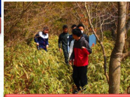
時には自然に立ち向かう！