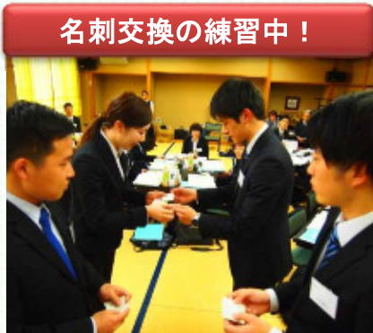
名刺交換の練習中！