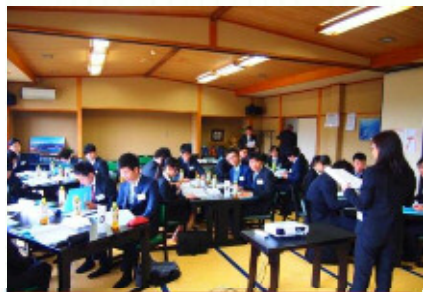
さあ、研修の始まりだ！

平成29年3月27日から31日にかけて新入社員研修を岐阜県恵那市にて行いました。 研修では、社会人としての自覚を持ち、ビジネスマナーを身につけ、同期との絆を育むことを目的に、様々な講義が行われました。 日々成長していく彼らはとても頼もしかったです！ その後、入社式をはさみ、引き続き工場研修、各部教育を行いました。