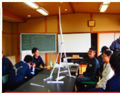
難問はチームで解決！