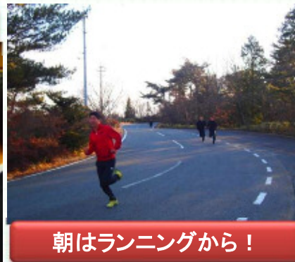
朝はランニングから！