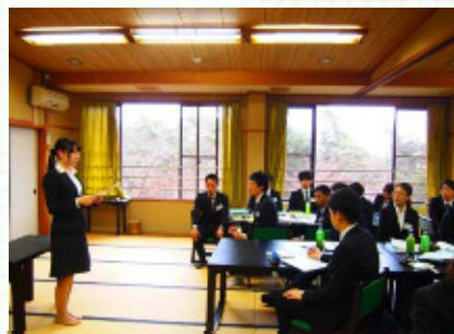
最初とは見違えるよう！