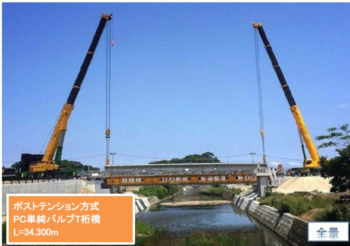
ポストテンション方式 PC単純バルブT桁橋 L=34.300m