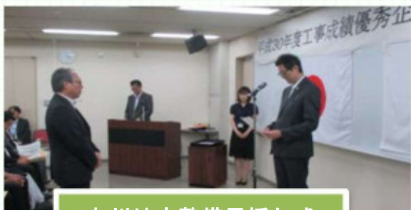
九州地方整備局授与式

工事成績優秀企業の認定を契機に、更なる技術向上を目指して、社会に貢献していきたいと思っております。