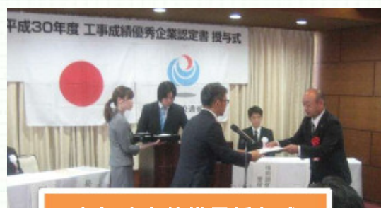
中部地方整備局授与式