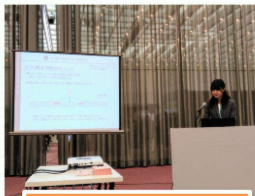
技術展示会内「技術紹介」