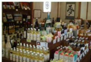
まずは試飲でお気に入り

明治時代にタイムスリップできる母屋・酒蔵の見学後、酒遊館で大吟醸、純米吟醸の他、リキュール、甘酒などを試飲、実際に飲んでから好きな一品を選ぶことができます。また、酒蔵グッズも販売しています。