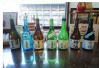
甘酒、粕漬など多くの酒以外商品も