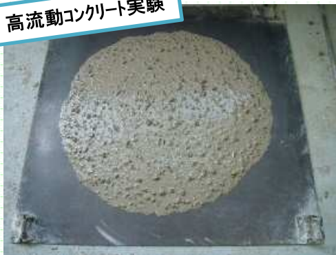
高流動コンクリート実験