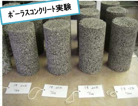
ホーラスコンクリート実験