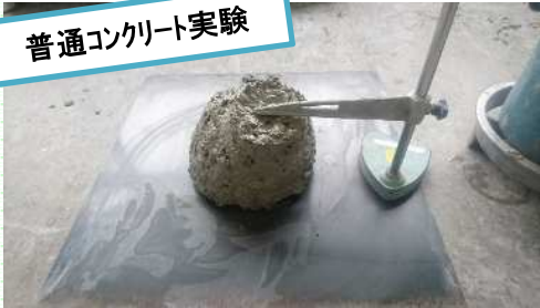
普通コンクリート実験