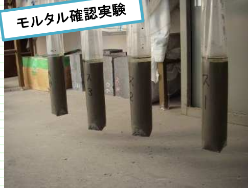
モルタル確認実験