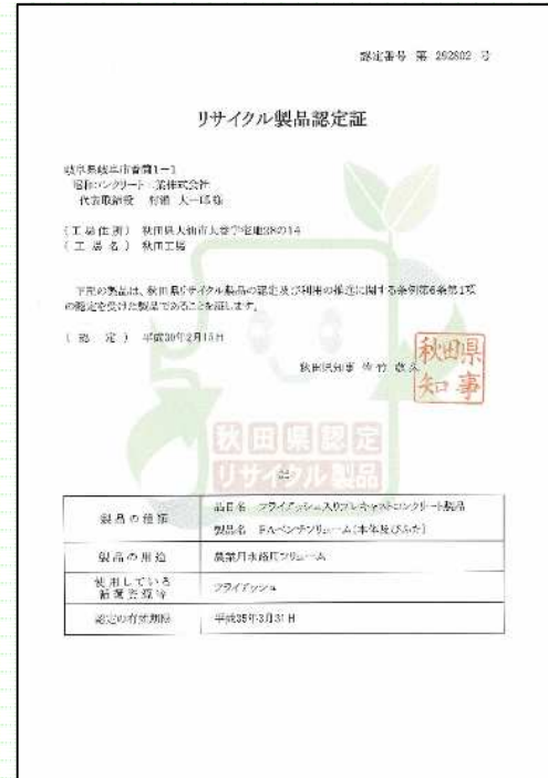
(秋田県)リサイクル製品認定証 (秋田工場、認定製品数:6)