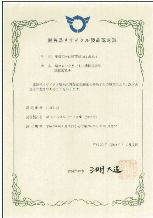
滋賀県リサイクル製品認定証 (滋賀工場、認定製品数:15)