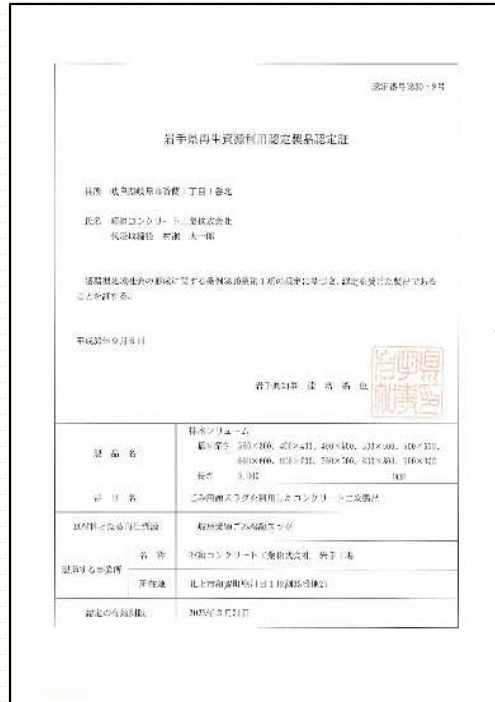
岩手県再生資源利用認定製品認定証 (岩手工場、認定製品数:7)