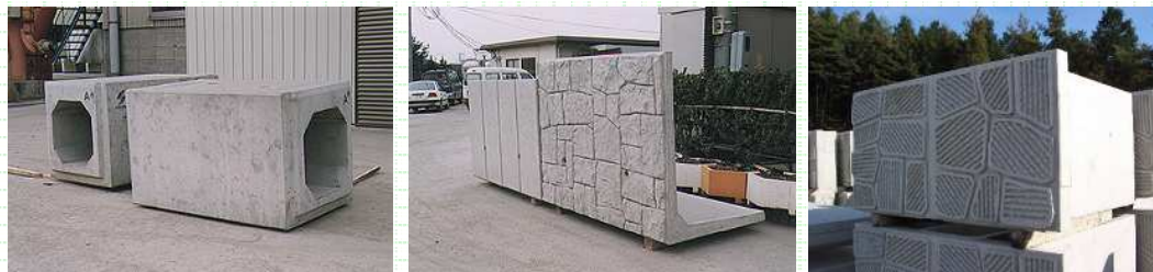
溶融スラグ利用製品の例

当社は、岐阜県にて2000年から全国で先駆けて溶融スラグ製品の製造を始めました。それから20年以上が経ち、岐阜県から始まった溶融スラグのリサイクルは、その後秋田、岩手、滋賀の各工場にも広がっています。秋田工場では、2018年よりフライアッシュの利用にも取り組み始めました。当社は、今後もコンクリート製品にできることを考え、リサイクルに取り組んでいきます。