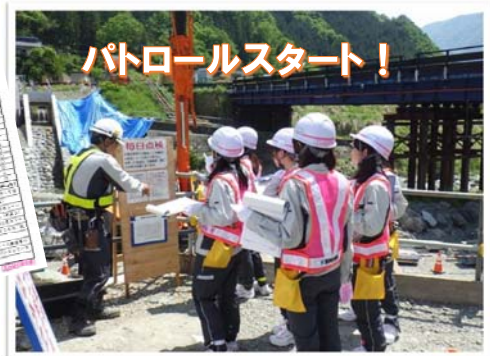
パトロールスタート!