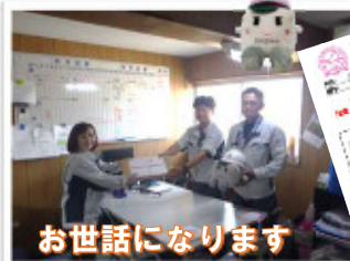
お世話になります