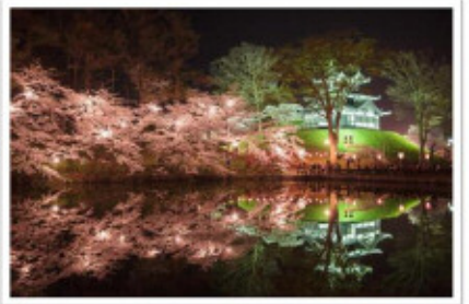
にいがた観光ナビ資料