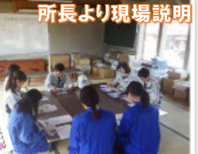
所長より現場説明