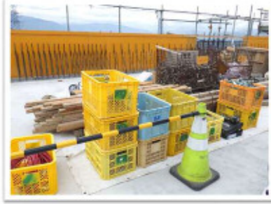
橋面上も含め、資材置き場は整理されていて良いですね。