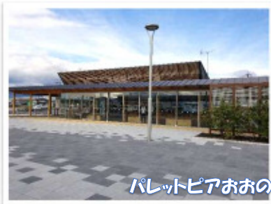
パレットピアおおの