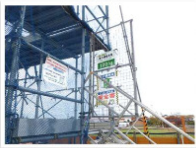
階段の幅が広いので、上り下りし易く安全面での配慮がなされて良いと思います。