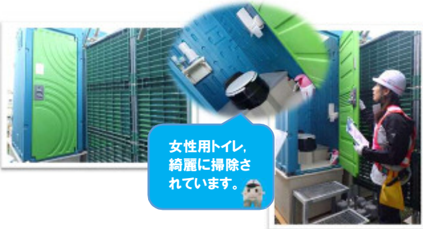
女性用トイレ、綺麗に掃除されています。