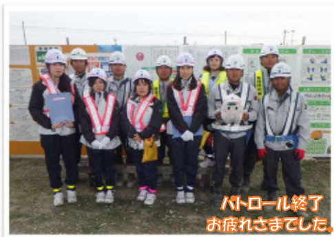
パトロール終了 お疲れさまでした。