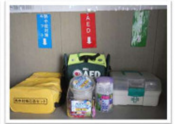
救急セット・AED等分かり易く表示してあり良いですね。