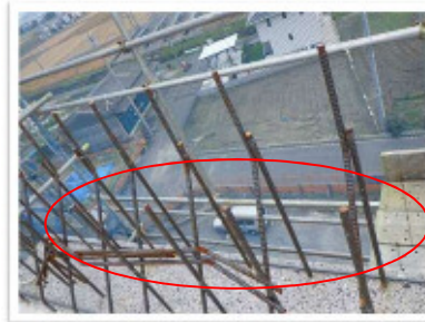
階段を撤去した際の開口部があり、墜落等の危険がありますので塞いでください。