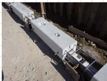
笠コンクリートブロック設置状況