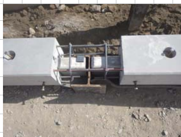
笠コンクリートブロック配筋