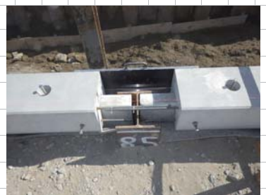
笠コンクリートブロック型枠設置