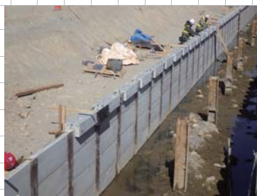
笠コンクリートブロック設置状況